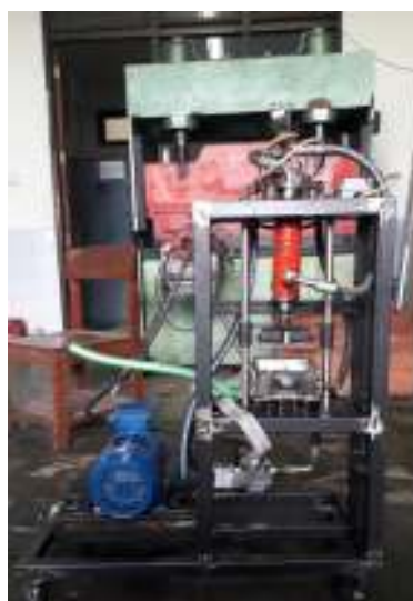
Fig. 1. Prototype.