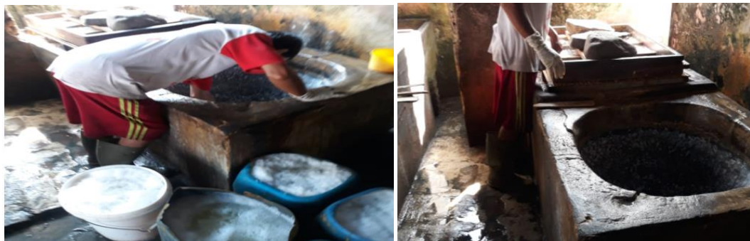
Gambar 4. Proses Perebusan Kedelai

Sebelum proses penggilingan pada gambar 3 kedelai terlebih dahulu dicuci dan direndam terdahulu selama 4 jam setelah digiling baru ke proses selanjutnya yaitu proses pemasakan seperti ditunjukkan pada gambar 3, dalam mengoptimalkan mutu produk yang baik perlu adanya pengontrolan kompor dengan bahan bakar wood pellet