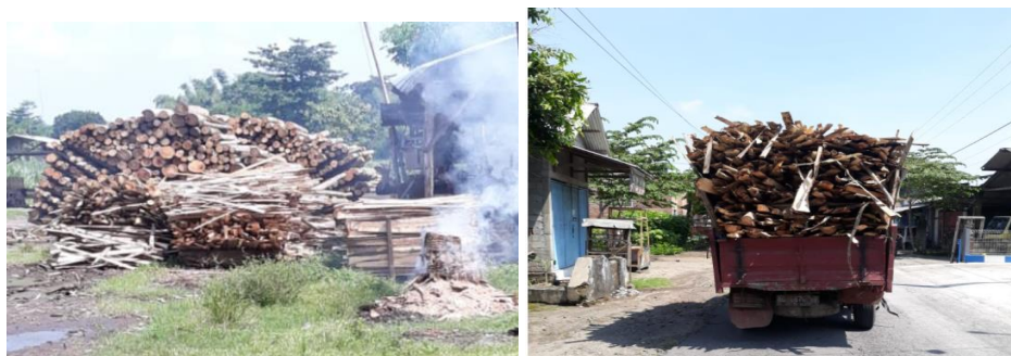
Gambar 8. Limbah dari penggergajian kayu.

Sekarang coba dihitung analisis efisiensi penggunaan bahan bakar pada UKM produksi, dalam sehari dapur kayu nyala selama 8 jam dikarenakan kapasitas dari pemasakan sebanyak 4 kg kedelai, sedangkan yang harus dimasak sebanyak 80 kg/hari sehingga dibutuhkan 20 kali pemasakan yang kurang lebih membutuhkan waktu selama 8 jam. Dari sini dapat dilihat bila menggunakan gas LPG perjam mengeluarkan biaya sebesar Rp 2.571 bila harga LPG 3 kg sebesar Rp. 18.000, bila menggunakan kayu per jam membutuhkan biaya sebesar Rp. 2.375 karena dalam satu truk harganya Rp. 190.000 bisa digunakan selama 80 jam dan bila menggunakan wood pellet harganya Rp.2500 per kg yang bisa digunakan selama 2 jam pembakaran. Bila dari hasil dikalikan 8 jam dalam satu hari wood pellet lebih murah dalam satu hari mengeluarkan biaya sebesar Rp. 10.000, untuk kayu Rp. 19.000 dan yang paling mahal diantara ketiga bahan bakar yang digunakan yaitu menggunakan LPG sebesar Rp. 20.571. dari analisis sederhana yang sudah dilakukan pastinya bahan bakar wood pellet bisa digunakan secara maksimal, selain itu bahan baku dari bahan bakar wood pellet ini dengan mudah didapatkan dengan memanfaatkan limbah dari penggergajian kayu, limbah industri perkayuan dan limbah perkebunan, briket kayu, terutama dapat diperoleh dari limbah industri perkayuan yang bahannya banyak di daerah Kabupaten Kediri seperti gambar 8 Limbah dari penggergajian kayu.