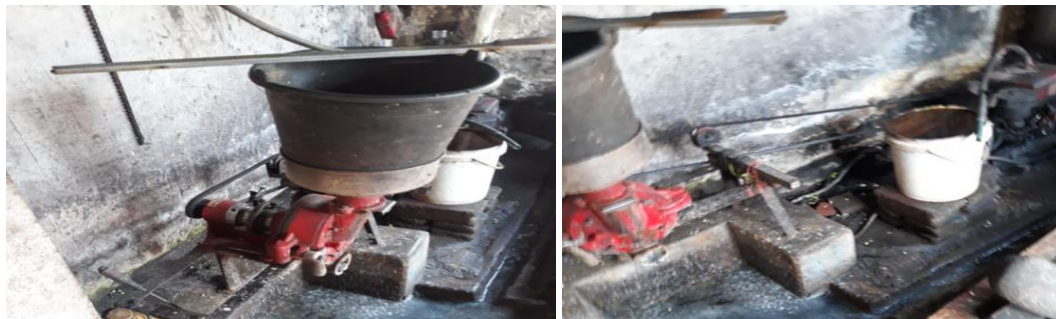
Gambar 3. Proses Penggilingan Kedelai

Dari gambar 2 yaitu proses pembuatan kompor wood pellet diatas digunakan beberapa alat penunjang dalam operasi kompor wood pellet agar bisa digunakan. Sumber energi menggunakan wood pellet dan ditambahkan sebuah blower motor listrik untuk menghasilkan angin dengan tekanan tertentu yang bisa diatur kecepatannya. Angin yang sudah dihasilkan oleh blower di tekan masuk ke dalam ruang bakar yang nantinya panas dalam ruang bakar akan ditransfer secara paksa keluar ruang bakar untuk memanaskan air yang digunakan untuk merebus kedelai, sebelum direbus kedelai terlebih dahulu digiling agar menjadi bubur kedelai seperti gambar 3 yaitu proses penggilingan kedelai.