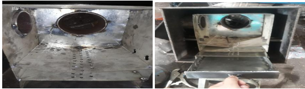
Gambar 2. Proses Pembuatan Kompor Wood Pellet

Dari gambar 2 yaitu proses pembuatan kompor wood pellet diatas digunakan beberapa alat penunjang dalam operasi kompor wood pellet agar bisa digunakan. Sumber energi menggunakan wood pellet dan ditambahkan sebuah blower motor listrik untuk menghasilkan angin dengan tekanan tertentu yang bisa diatur kecepatannya. Angin yang sudah dihasilkan oleh blower di tekan masuk ke dalam ruang bakar yang nantinya panas dalam ruang bakar akan ditransfer secara paksa keluar ruang bakar untuk memanaskan air yang digunakan untuk merebus kedelai, sebelum direbus kedelai terlebih dahulu digiling agar menjadi bubur kedelai seperti gambar 3 yaitu proses penggilingan kedelai.