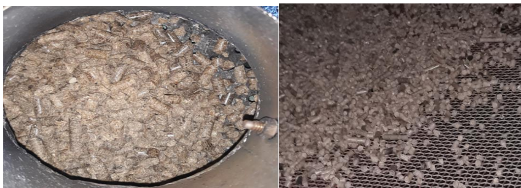
Gambar 7. Wood Pellet