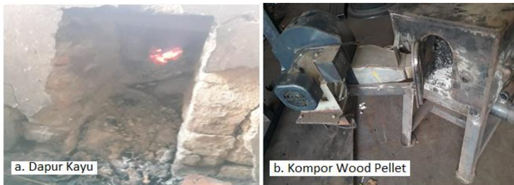
Gambar 6. Pembakaran Dapur Kayu Dan Wood Pellet

Dalam Pelatihan dan pendampingan yang sudah dilakukan bersama mitra, yaitu tata cara memakai kompor wood pellet seperti perbandingan pemakaian bahan bakar harus sesuai, udara yang dipakai harus mencukupi, waktu yang diperlukan untuk proses pembakaran harus cukup, panas yang cukup untuk memulai pembakaran dan kerapatan yang cukup untuk merambatkan nyala api agar hasil dari perebusan kedelai mendapatkan hasil yang maksimal. Selain itu juga memberikan sedikit pandangan kepada mitra mengenai konversi energi yaitu suatu proses perubahan dimana bentuk energi dari yang satu menjadi bentuk energi lain yang dibutuhkan, mengartikan bahwa untuk memperoleh suatu bentuk energi seperti limbah kayu dirubah bentuknya menjadi wood pellet kemudian dibakar menjadi energi panas yang digunakan untuk perebusan itu merupakan salah satu contoh untuk mendapatkan energi panas yang tidak dapat diperoleh secara langsung, tetapi ada proses konversi energi sebelum mendapat energi panas yaitu menggunakan proses pembakaran yang membutuhkan bahan bakar dalam kasus ini wood pellet seperti ditunjukkan pada gambar 6 Pembakaran Dapur Kayu Dan Wood Pellet .