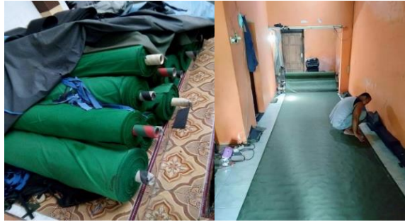
Gambar 2. Pemotongan Kain

Tahap awal dari proses produksi Tas Pos yaitu pemilihan kain dan pemotongan kain dengan cara mengukur ukuran sesuai, yang di tentukan untuk pembentukan motif yang akan dibuat. Selanjutnya, kain yang akan dipotong digelar di lantai untuk mempermudah proses pemotongan kain.