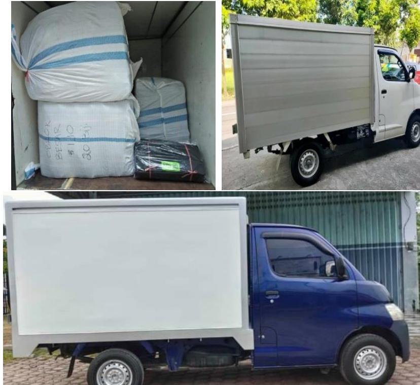
Gambar 4. Pengiriman pada mobil Box

Proses pengiriman atau transportasi Tas pos di UMKM Putra Jaya ini menggunakan mobil Box untuk daerah Surabaya, Malang, dan Pasuruan serta pengiriman melalui ekspedisi cargo untuk wilayah Kalimantan.