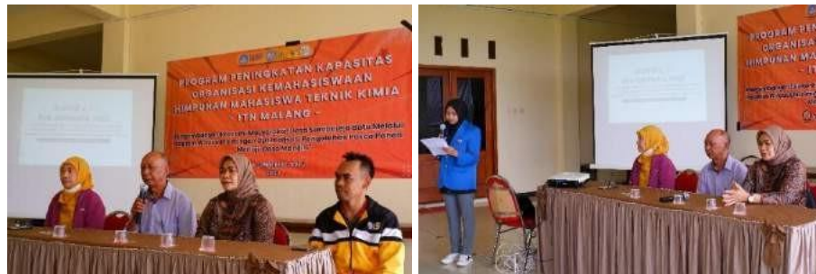
Gambar 1. Kegiatan Diskusi bersama Perangkat Desa Sumberejo

Kegiatan yang akan dilakukan diimplementasikan dalam program pengabdian masyarakat dengan tujuan untuk membantu dan mengatasi permasalahan masyarakat Sumberejo dalam pengolahan komoditas pasca panen. Melalui permasalahan yang ada dilakukan diskusi mengenai kegiatan yang akan dilakukan dalam penanganan hasil panen Desa Sumberejo.