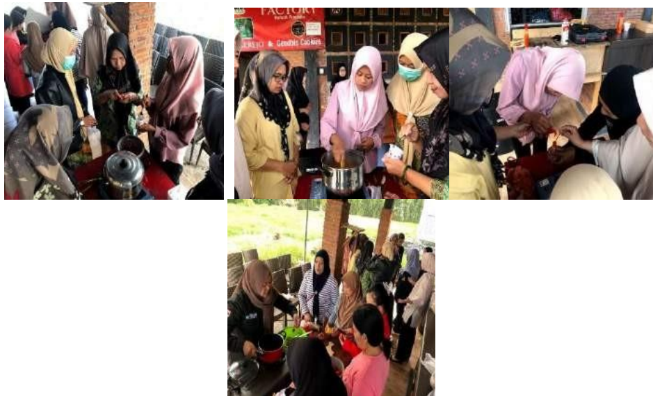
Gambar 3. Pelatihan pembuatan pasta tomat hingga pengemasan.

Kegiatan pelatihan Pembuatan Pasta Tomat dilakukan dengan tujuan pengolahan pasca panen yang salah satu hasilnya adalah tomat agar harga jual tomat tetap tinggi adalah dengan mengolah tomat menjadi produk olahan yang bernilai ekonomis, pada kegiatan ini tim PPK ORMAWA mengajak Masyarakat untuk ikut serta melakukan langkah - langkah proses pengolahan pengolahan pasta tomat, pupuk organik gel, dan briket hingga menjadi produk dan lanjut ke tahap pengemasan [4], [5].