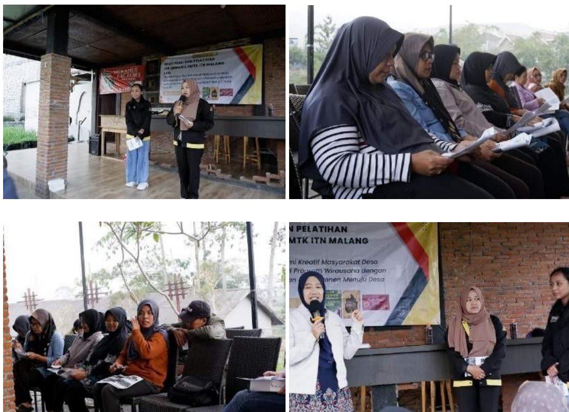
Gambar 6. Penyuluhan Marketing Produk ke Masyarakat

Kegiatan ini bertujuan untuk memberikan informasi kepada masyarakat tentang pemasaran dari produk pasta tomat yang secara langsung dipasarkan melalui kemitraan dengan pelaku UMKM dan melalui media sosial seperti Whatsapp Business , Instagram , dan Facebook sekaligus cara promosi dan pengoperasiannya [6].