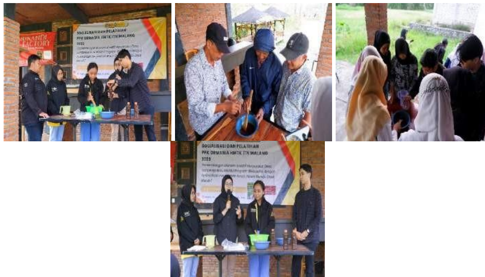
Gambar 4. Pelatihan Pembuatan Pupuk Organik Gel