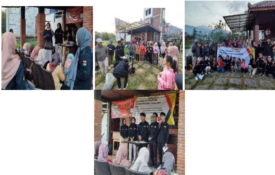
Gambar 5. Pelatihan Pembuatan Briket dimulai dengan Proses karbonisasi hingga proses pencetakan briket