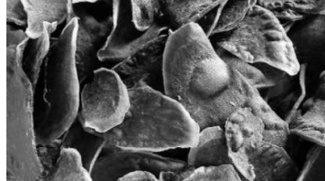
Gambar 5 . Kripik ubi jalar ungu hasil penggorengan