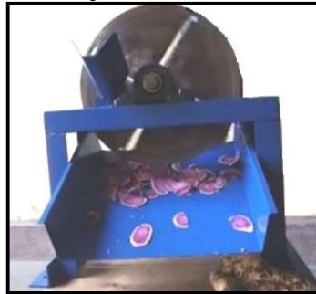
Gambar 1. Mesin perajang ubi jalar

Pengadaan alat atau mesin pemotong ubi menjadi bahan baku kripik ubi dilakukan dengan cara penyuluhan pada tahapan pembuatannya. Selanjutnya dilakukan demonstrasi menggunakan alat atau mesin pemotong ubi sebagai bahan baku kripik.