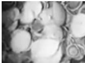
Gambar 3 . Bahan keripik hasil perajangan