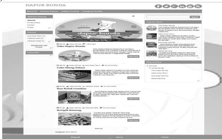
Gambar 2.2 Final Artwork Halaman Home (Beranda)

Halaman ini mempunyai fungsi untuk menyampaikan informasi kepada pengunjung blog. Terdapat 4 buah kategori pilihan pada halaman ini. Tata letak halaman hampir sama seperti halaman sesuai dengan kapasitas template pada blog, background menggunakan logo UMKM. Hal ini sengaja dilakukan agar desain tetap terjaga kesederhanaannya dan terlihat balance (seimbang).